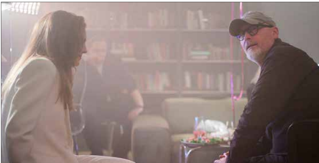
Wojciech Smarzowski na planie

rolę), by nie odczuć autentyczności tej historii. W pewnej chwili Smarzowski porzuca filmową narrację, na ekranie oglądamy coś na kształt telewizyjnej terapii zbiorowej – młode, a już zniszczone przez życie kobiety (samotne matki, skatowane rozwódki czy uciekinierki od mężów-przemocowców) opowiadają o swoich doświadczeniach. Gosia milczy, ale czujemy, że jest jedną z wielu, być może – mimo milczenia – bardziej doświadczona od innych.