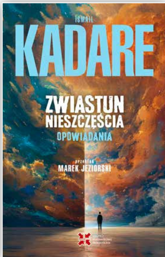
Wybór opowiadań „Zwiastun nieszczęścia” w przekładzie MJ ukazał się w 2025